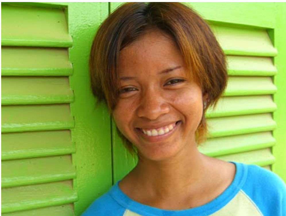
Reth , avril 2006 responsable de la troupe, Hip Hop For Hope