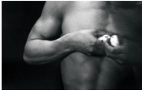
Man and Woman #33 (1960) © Eikoh Hosoe

全12カ所の京都のシンボリックな会場を舞台に、約10カ国のアーティストからなる国際色豊かな写真展を同時開催 京都グラフィー 国際写真フェスティバル、京都から世界へ — www.kyotographie.jp