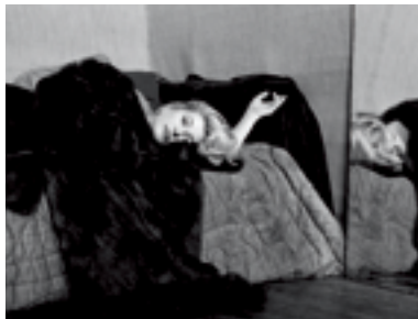
Catherine Deneuve

ダム・タイプを中心メンバーである高谷の映像作品『Ice Core』『Snow Crystal』が平安の歌人・西行ゆかりの茶室西行庵で展示される。雪氷学者・中谷宇吉郎が掘削した南極の氷床コアの写真を使用したインスタレーションが静かに語る地球の時間と、悠久の空間がどう融合するかが見物。