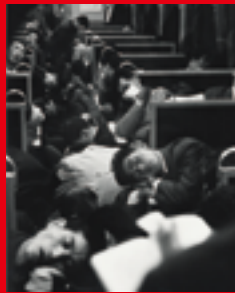
People sleeping in a night train (1964) © Nicolas Bouvier, Musée de l'Élysée, Lausanne