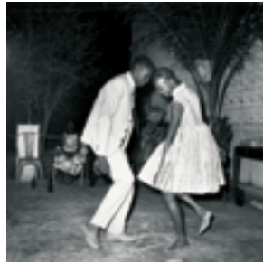
Nuit de Noël (1963) Courtesy MAGNIN-A © Malick Sidibé

豊田秀吉の妻・ねね終焉の寺で、舞踏家・土方巽をモデルにした代表作『鎌鼬』を模した巨大な作品や、若き日の草間彌生のポートレートを掛け軸にした作品など、日本を代表する写真家、細江英公の集大成が和の設えによって展示される。