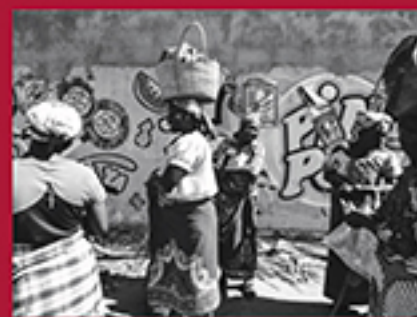
FOR AS LONG AS I LIVE, RAMOS JANETE