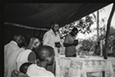
BUSCAR E ESPERAR, CASTELO ADELUM