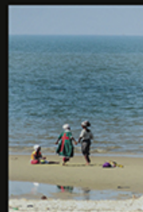
SEM TÍTULO, CRESPO PEDRO