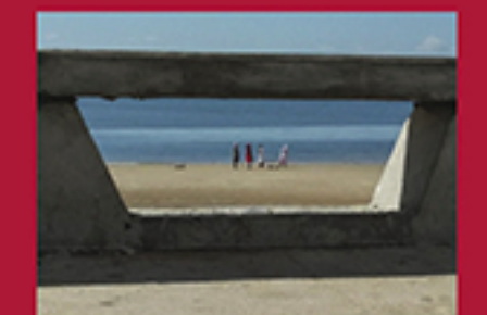
BEACH WORSHIPPERS, WILLIAMSON MORVEN