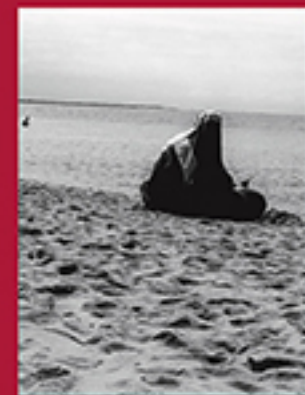
DOWNLOADING, T AMELE EUSÉBIO GUSTAVO