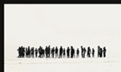
COMMUNIAR FINAL, BATTAGLIA CHARLOTTE