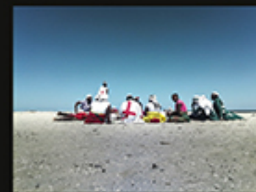
MAZIONES... AREIA BRANCA, PELE NEGRA E O AZUL DO CÉU 1, MENDES PATRICIA