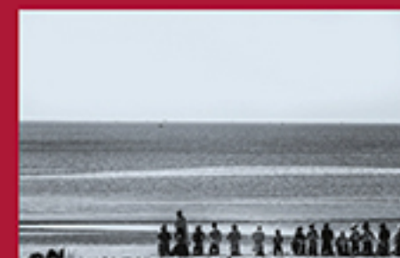
LIGAÇÕES MARÍTIMAS, VOMBE MAURO