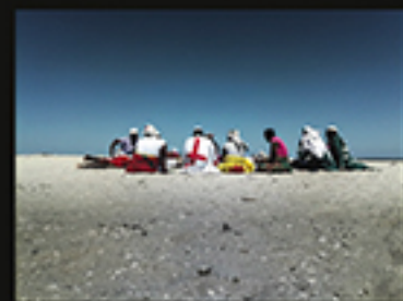
MAZIONES... AREIA BRANCA, PELE NEGRA E O AZUL DO CÉU 2, MENDES PATRICIA