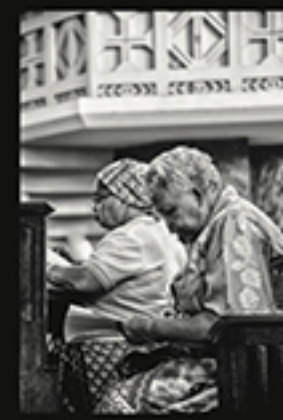
HORA DE REZAR, LE PECHOUX JUN