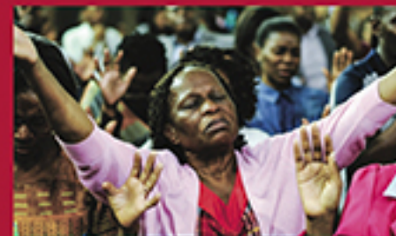
RENDIÇÃO A DEUS, SANTOS GLÓRIA