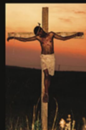
A CRUCIFICAÇÃO DE JESUS CRISTO, CASSIMO NASIR