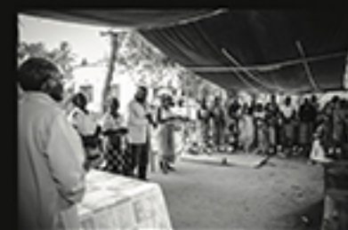
OVELHAS E OVELHAS, CASTELO ADELUM