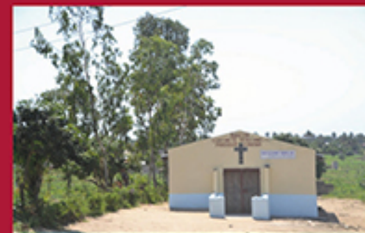
BELIEVING IS AN INDIVIDUAL TRUTH, MATOLA ALBINO