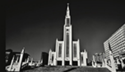
HORA DOURADA, LE PECHOUX JUN