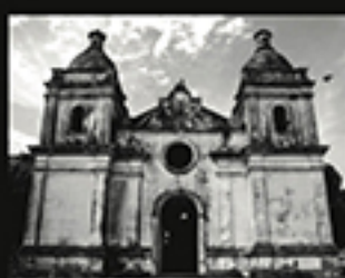
VELHA CATEDRAL, BONNET THOMAS