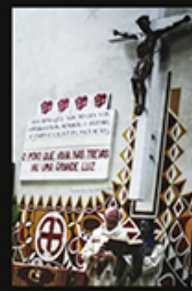
A RELIGIÃO NÃO CONHECE RAÇAS, MAHUMANA ALBINO