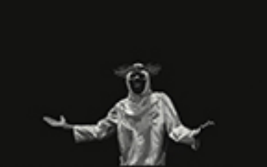
O CRISTO DANÇANDO, LE PECHOUX JUN