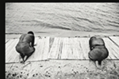
NHAMUSSORO, NEVES CUNA AMILTON