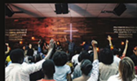
INEXPLICÁVEL GRAÇA, DOS REIS LUDMILA