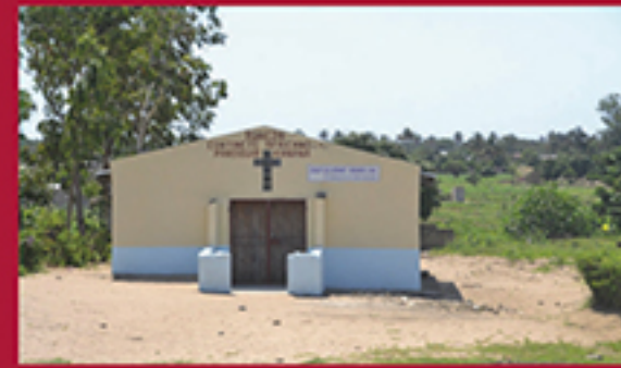
BELIEVING IS AN INDIVIDUAL TRUTH, MATOLA ALBINO