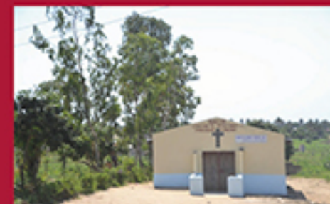
BE HUMBLE TO YOUR FAITH, MADUELA FREDERICO