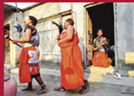
DE TXOWAS & CAJADOS EM PUNHO AS MATWASANAS FLUTUAM NO MUNDO OCULTO, UQUEIO CARLOS