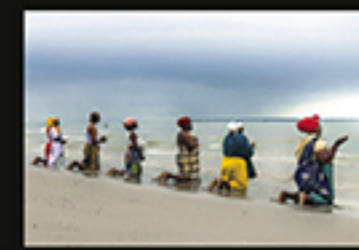
MEMBERS OF THE ZION CHURCH IN MAPUTO, PRAYING IN THE BEACH, ESCANDE GREGORY