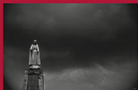
NOSSA SENHORA, ZANDAMELA HELDER CONSTANTINO MACHATINE