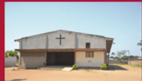
BE HUMBLE TO YOUR FAITH, MADUELA FREDERICO