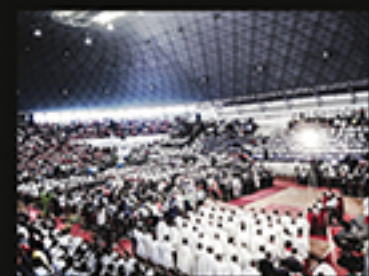
DIFERENTE RELIGIÕES UMA ÚNICA CRENÇA, NHAMBE HILTON