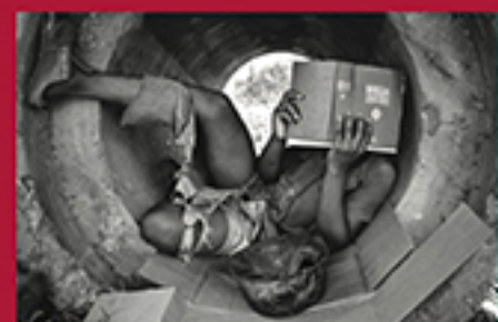
HOMEM DA CAVE, XISTO FERNANOO