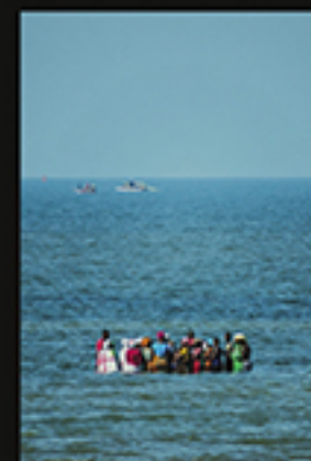
SEM TÍTULO, CRESPO PEDRO