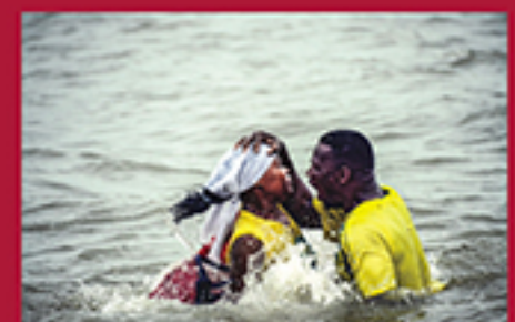
O SUFRÁGIO DAS ÁGUAS, USSENE NAITA