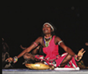
DANÇA TRADICIONAL EM MOÇAMBIQUE, BONNET THOMAS