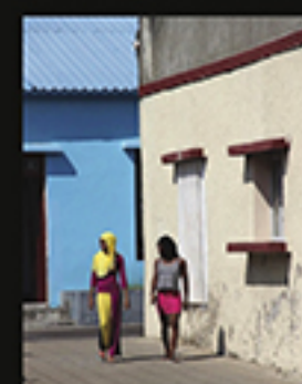
AMIZADE ENTRE DUAS MULHERES, DIAS PAULO