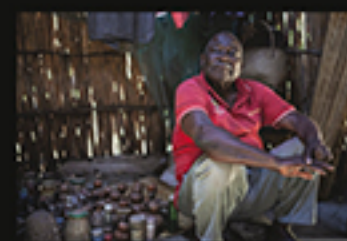
CURANDEIRO, LE PECHOUX JUN